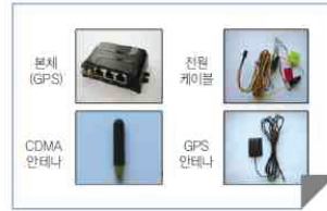
→ GPS 장착