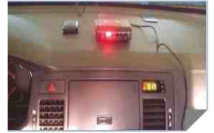
→ GPS 작동 확인